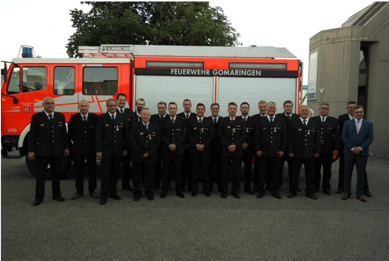
Übersicht der geehrten und beförderten Kameraden

*Kompletten Bericht inklusive aller Bilder könnt ihr auf der Homepage sehen