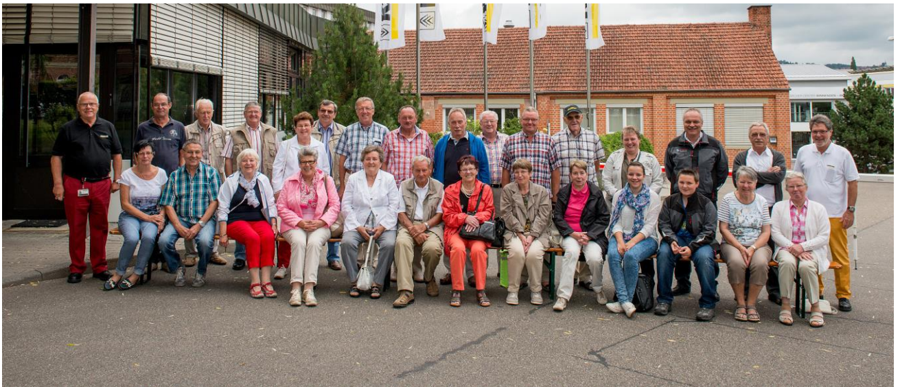
Gruppenbild Firma Kärcher