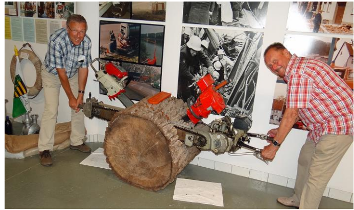
Im Feuerwehrmuseum Winnenden